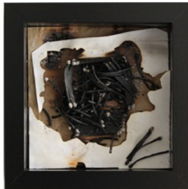
Abb.1 Objekt "Heimat"